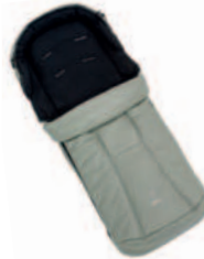
Winterfußsack GTX 5829-63-847 Winterfußsack GTS/GTR 5846-63-847