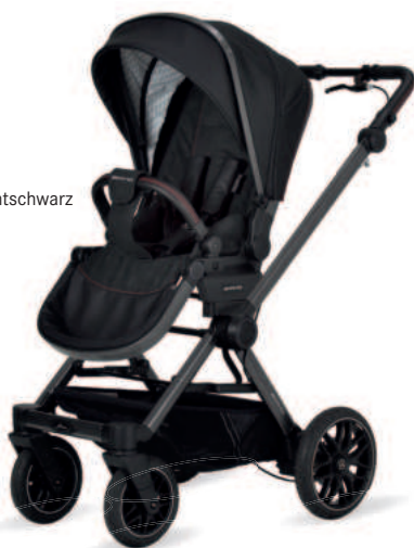
AMG GT 2 2385-193-850 nachtschwarz

Cupholder – einfache Befestigung – Babyflasche immer griffbereit – im Lieferumfang enthalten