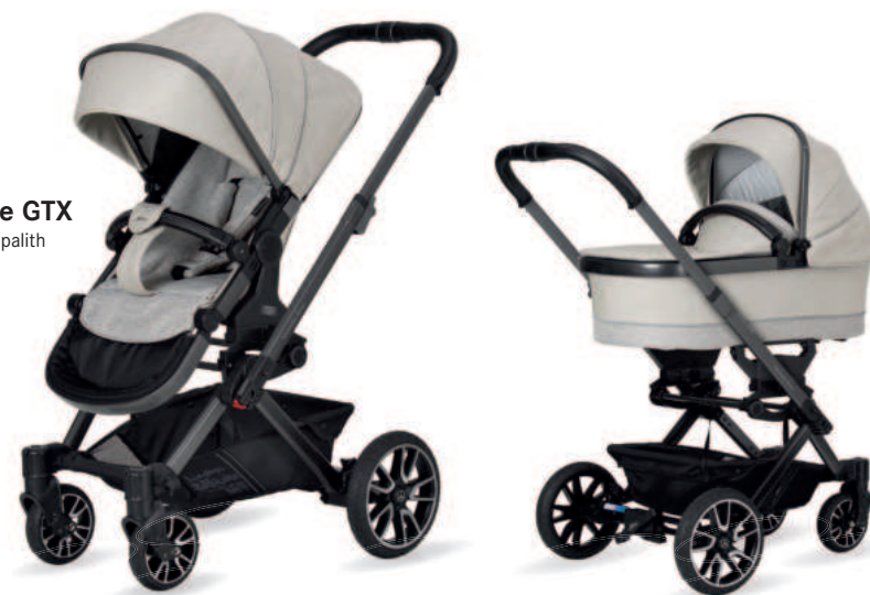
Avantgarde Kinderwagen mit Falttasche Premium (als Zubehör erhältlich)