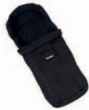
Fußsack AMG GT² 5840-63-851