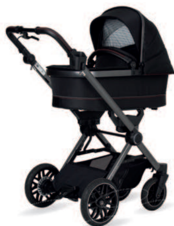
AMG GT 2 Kinderwagen mit Falttasche Premium (als Zubehör erhältlich)