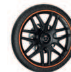
Kreuzspeichenfelge original AMG Design, inkl. Luftkammer-Bereifung und einstellbarer Federung