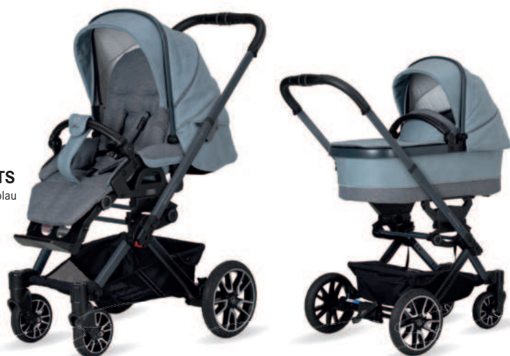
Avantgarde Kinderwagen mit Falttasche Premium (als Zubehör erhältlich)