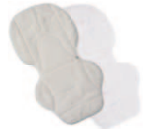
Wendeauflage „cozy“ GTX/GTS 5843-00-847 Wendeauflage „cozy“ GTR 5848-00-847