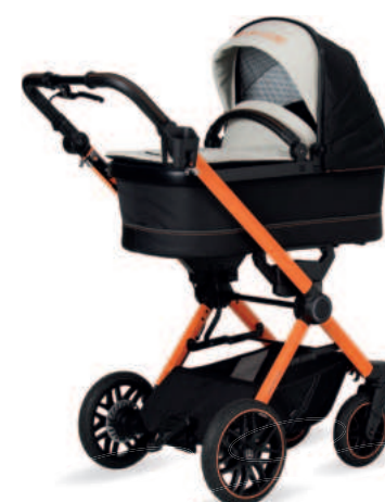
AMG GT 2 Kinderwagen mit Falttasche Premium (als Zubehör erhältlich)