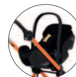
AMG Fahrgestell mit Babyschale (Adapter als Zubehör erhältlich)