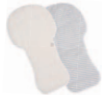
Wendeauflage „cozy“ 5844-00-851