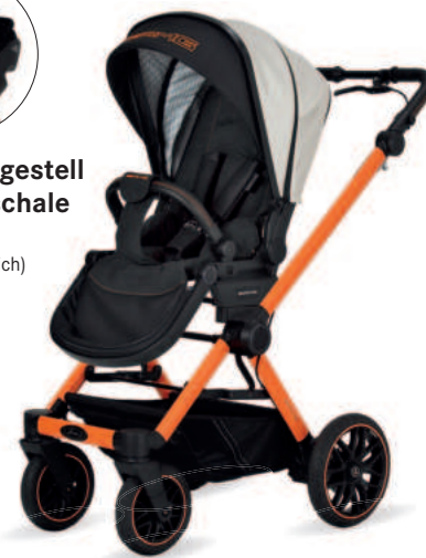
AMG GT 2 2385-193-851 magmabeam