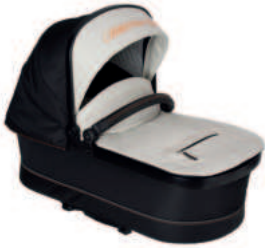
Falttasche Premium 4078-07-851