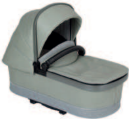
Falttasche Premium 4077-07-847