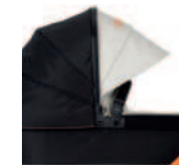
ausklappbare Sonnenblende bei Sitzeinheit und Falttasche Premium